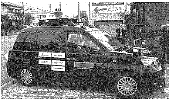
上部にセンサーなどを取り付けた自動運転タクシー=11日午前、西尾市

NTTドコモは11日、西尾市で交通規制なしで実施した。車載のタクシーの自動運転の実証実験を始めた。市街地の公道を対向車や歩行者がいる状況で走行し、安全性能を確認した。2021年度以降、同市での定期的な運行も検討する。